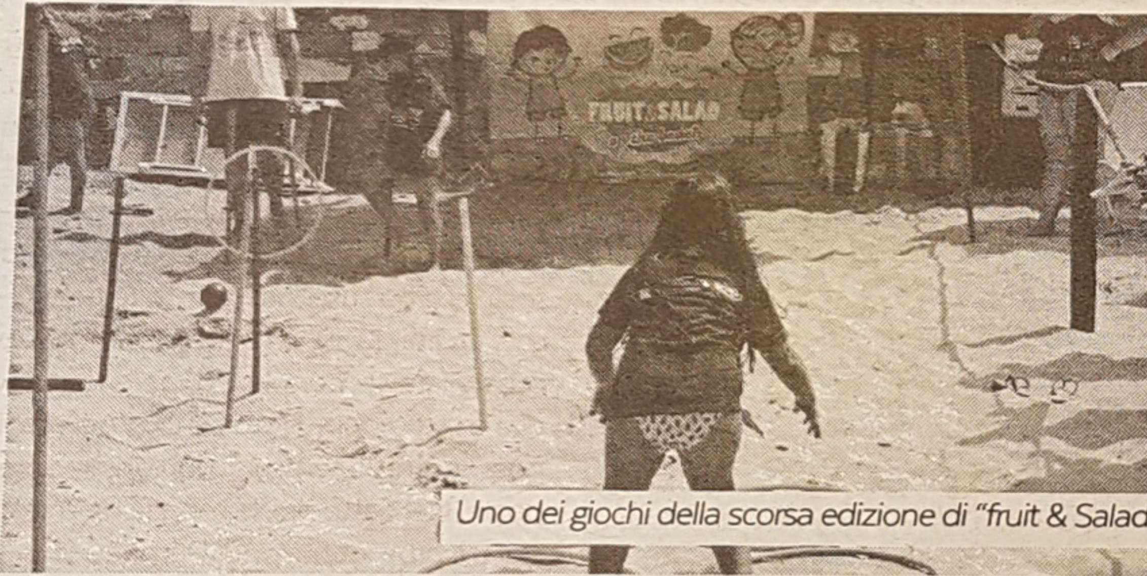
Uno dei giochi della scorsa edizione di "fruit & Salad"

BATTIPAGLIA. arà presentata il prossimo 9 Febbraio alla Fiera internazionale dell'ortofrutta 'Fruit Logistica' di Berlino la settima edizione di 'Fruit & Salad on the beach', la campagna di sensibilizzazione al consumo di frutta e verdura che si tiene annualmente sulle